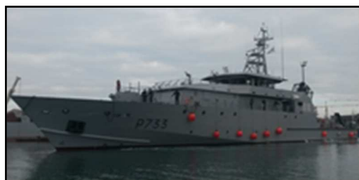
2 x 156 kW hybride - Navy