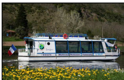
2 x 22 kW batteries