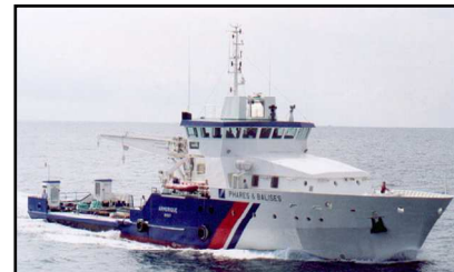
2 x 475kW +1 x 340kW

Les caractéristiques de cette plaquette commerciale n'ont pas de caractères contractuels, la société ENAG se réservant le droit de les modifier sans préavis. Nous consulter avant l'intégration technique.